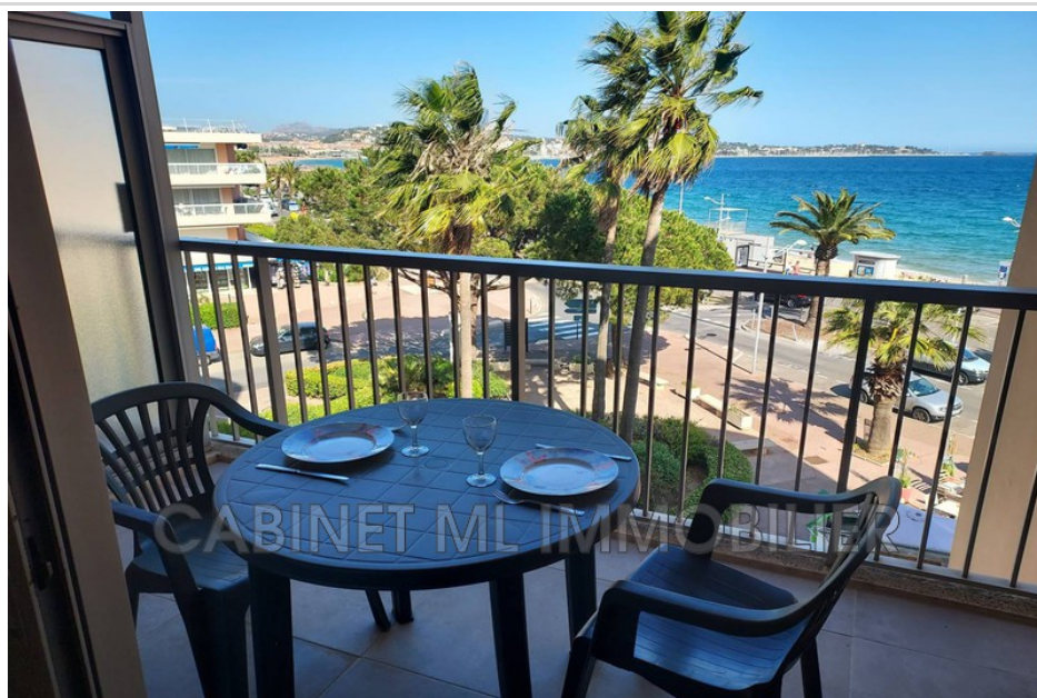
Studio 134 Fréjus